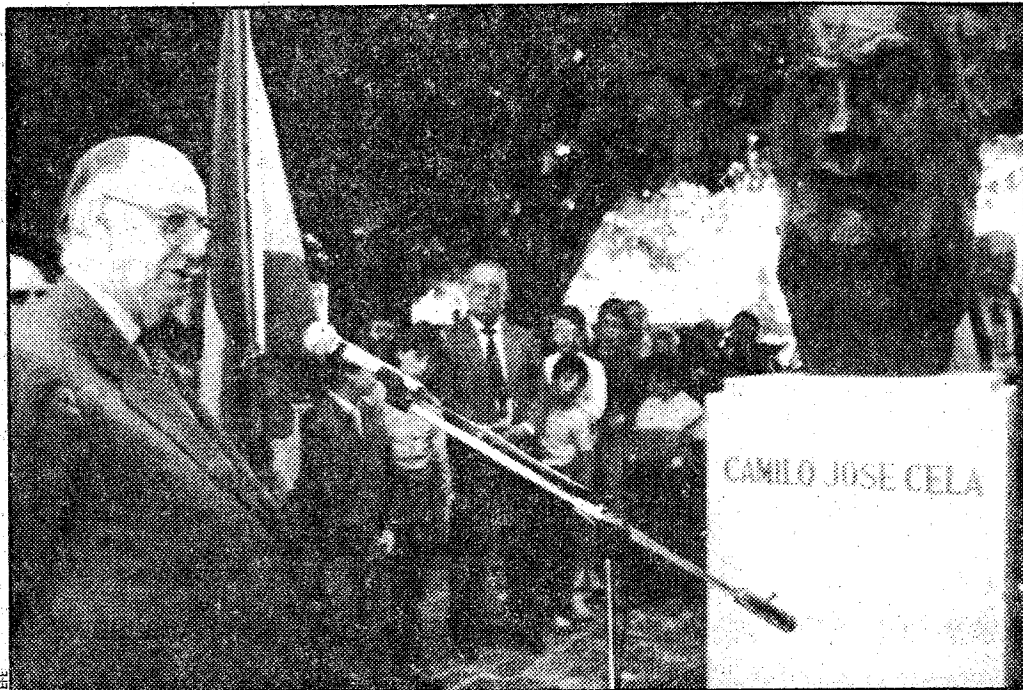
Cela, durante el acto de inauguración de su busto, obra póstuma de Pablo Serrano

Los actos de homenaje a Cela contaron con la presencia de Xerardo Fernández Albor, presidente de la Xunta, de otras autoridades y familiares del escritor,