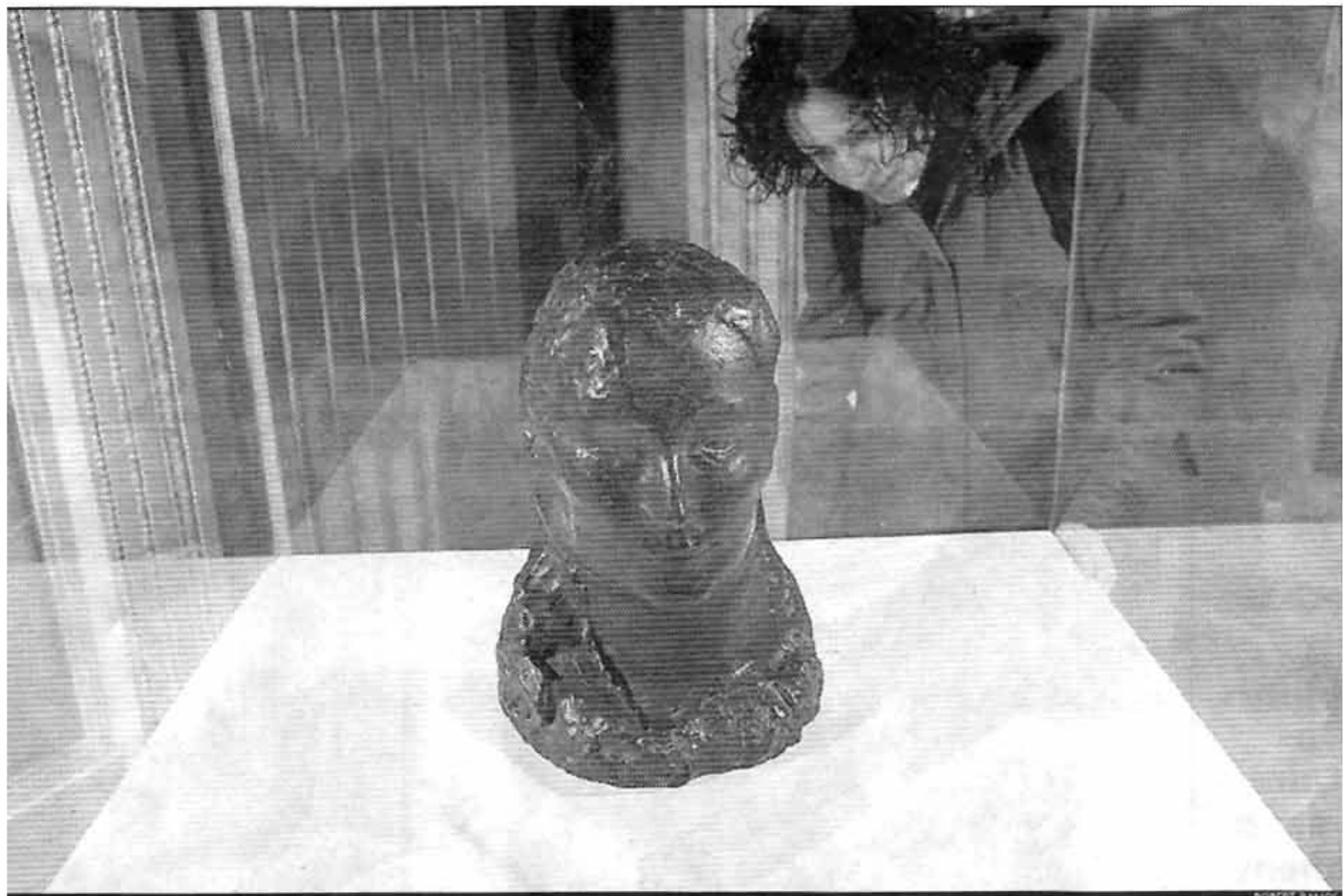
'Cap de dona (Fernande)', del 1906, és la segona escultura que tindrà el Museu Picasso

El Museu Picasso va presentar també ahir el Carnet de carnets , donat per la fundació privada Noguera.